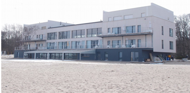
Zatoka Sztuki, Sopot, Al. Mamuszki 14